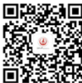
长安大学教育基金会